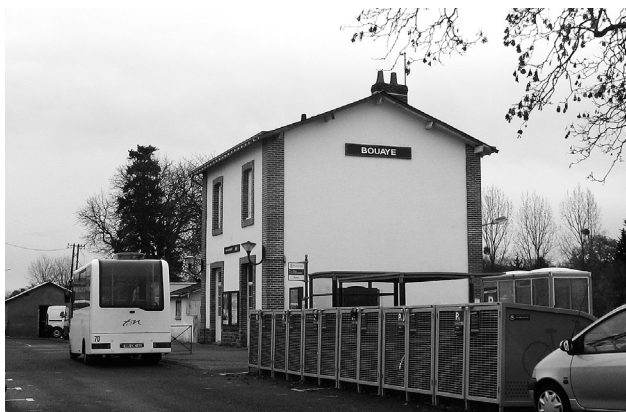
2 réalisations de Nantes Métropole : la navette Brains-St Aignan et le véloparc à la gare de Bouaye

En matière de voiries, des investissements de 2,8 millions d'euros sont prévus sur la période 2010-2014. Deux projets ont été réalisés récemment : la rénovation de la rue du Stade, inaugurée en même temps que l'ensemble sportif Bellestre, et l'éclairage public du village de la Barcalais.